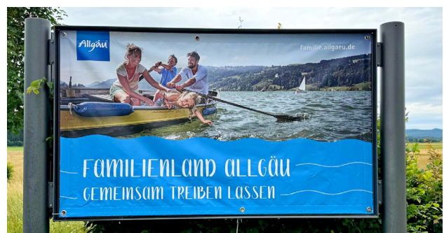
XL-Infobanner an der Zufahrt zum Park an der „Allgäuallee“.