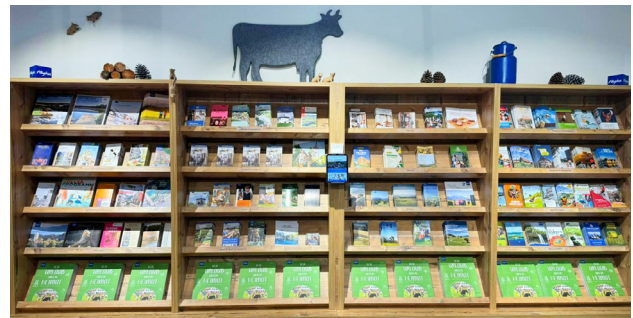
Menge und Anlieferung der Prospekte nach Absprache. Anlieferung frei Haus.

In der Touristinfo im Park können Sie als Partner Prospekte auslegen. Eine der wirkungsvollsten Möglichkeiten, neben dem Magazin „Dein Urlaub. Unsere Heimat.“, auf Angebote hinzuweisen. Die Prospekte werden durch die Mitarbeiter der Touristinfo permanent gepflegt, ergänzt und in die Beratung eingebunden. Die Präsentationsfläche der Touristinfo ist begrenzt, daher kann es bei großer Nachfrage möglich sein, dass die Vergabe freier Auslageplätze nur nach Verfügbarkeit erfolgt.