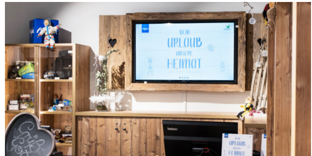
55 Zoll/140 cm Bildschirmdiagonale, hochauflösende Darstellung.

Anzeigen nach unserem vorgegebenen Layout.