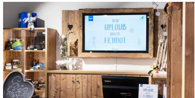
55 Zoll/140 cm Bildschirmdiagonale, hochauflösende Darstellung.

Anzeigen nach unserem vorgegebenen Layout.