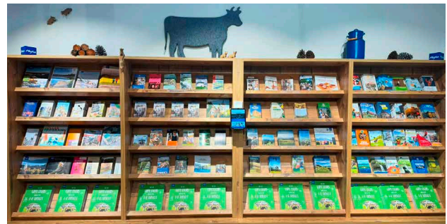
Menge und Anlieferung der Prospekte nach Absprache. Anlieferung frei Haus.

In der Touristinfo im Park können Sie als Partner Prospekte auslegen. Eine der wirkungsvollsten Möglichkeiten, neben dem Magazin „Dein Urlaub. Unsere Heimat.“, auf Angebote hinzuweisen. Die Prospekte werden durch die Mitarbeiter der Touristinfo permanent gepflegt, ergänzt und in die Beratung eingebunden. Die Präsentationsfläche der Touristinfo ist begrenzt, daher kann es bei großer Nachfrage möglich sein, dass die Vergabe freier Auslageplätze nur nach Verfügbarkeit erfolgt.