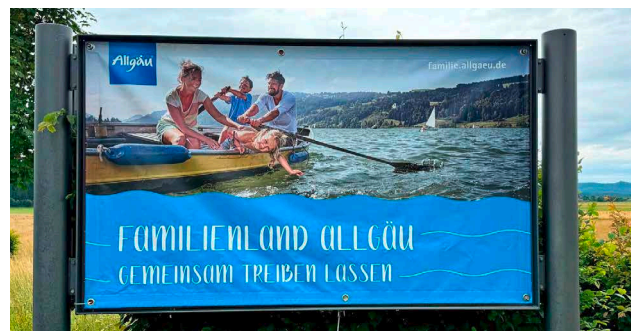
XL-Infobanner an der Zufahrt zum Park an der „Allgäuallee“.